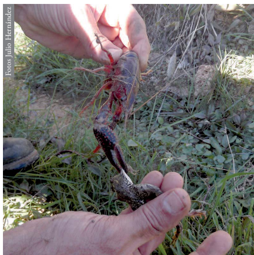
Figura 1. Ataque de P. clarkii a P. perezi en Archidona, Málaga.

El 1 de noviembre de 2013, en un camino cerca de la Reserva Natural de Laguna Chica de Archidona (Málaga; cuadrícula UTM: 30S UG80; 740 msnm), el segundo autor de esta nota escuchó vocalizaciones de agonía emitidas por un individuo subadulto de P. perezi , en forma de maullidos intermitentes de distinta duración. El ejemplar, situado a la entrada de una oquedad en el talud de tierra de un canal de regadío, tenía una de las patas traseras atrapada por las quelas de un ejemplar de P. clarkii de gran tamaño (Figura 1), y parte de su extremidad había sido parcialmente devorada (Figura 2). Finalmente se pudo rescatar a la rana y ésta escapó con vida. Esa mañana se capturaron más de 50 ejemplares de cangrejos, la mayoría jóvenes, a lo largo de un buen tramo del canal cercano a Laguna Chica. Se observaron más ejemplares pequeños de P. perezi con alguno de sus miem-